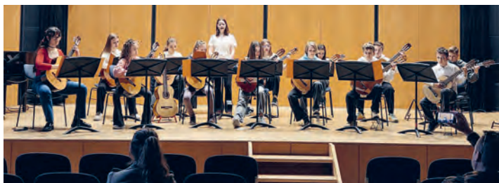
Das Ensemble Flying Notes beim Konzert in Erding/D im März dieses Jahres.

Die Konzertreise bietet den Jugendlichen die Möglichkeit, internationale Festivalatmosphäre zu erleben und wertvolle musikalische Erfahrungen zu sammeln.