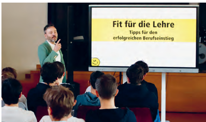
Workshop Fit für die Lehre

re klassenspezifische Projekte wie zum Beispiel Landart im Bereich Kunst oder die Fertigstellung eines Filmprojekts ergänzten die Woche.