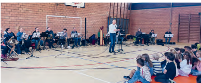
Die Lehrpersonen der Musikschule beim Schulhauskonzert in Rheineck.

Im Zentrum stand Sergej Prokofjews bekannte musikalische Erzählung, bei der die verschiedenen Figuren jeweils durch be-