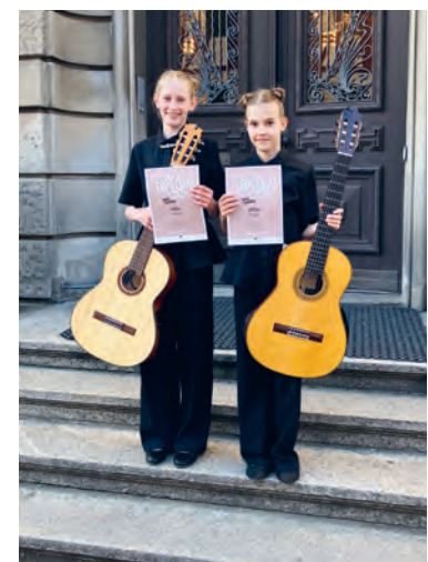
Die beiden Preisträgerinnen vor dem Konservatorium Zürich.