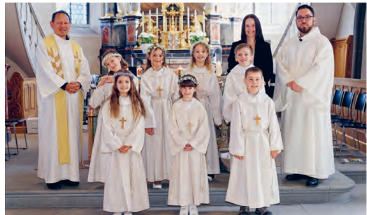
Sieben Kinder aus unserer Pfarrei empfangen die erste heilige Kommunion in einer festlichen Feier.