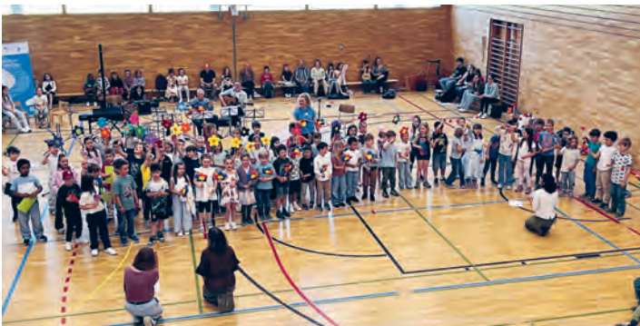
Ein voller Erfolg war das Zwerglikonzert in der Turnhalle Kugelwis in Rheineck.

Im Anschluss fand der zentrale Infoabend im Oberstufenschulhaus Rheineck statt. Auch hier nutzten viele Familien die Gelegenheit, Instrumente kennenzulernen, Lehrpersonen zu treffen und sich über den Musikunterricht in Thal, Rheineck und St. Margrethen zu informieren.