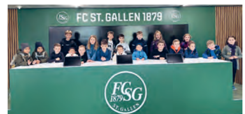
Stadionbesichtigung während der Kurswoche 2025

Merken sie sich das Datum vor, markieren sie sich die Woche im Kalender und ermöglichen sie ihren Kindern damit unvergessliche Stunden.