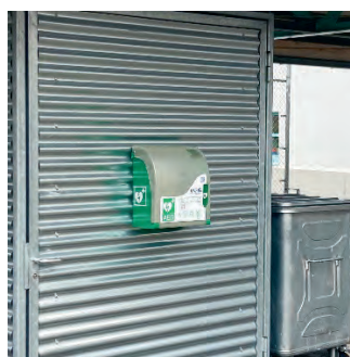
Schulhaus Risegg Velounterstand