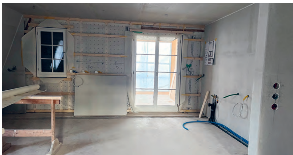
Wohnung Küche mit Türe in Loggia