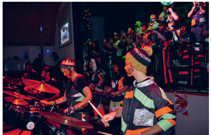
Auftritt der Rübä-Forzer Thal an der Hüülernacht 2024

Nach unserem Auftakt am 13. Januar an der Hüülernacht in Wolfhalden freuen wir uns auf viele bekannte Gesichter im Februar, zum Beispiel an unserer Thaler Beizentour am 9. Februar oder ganz international am Wochenende des 3. und 4. Februars in Feldkirch. Auch macht die Guggenmusik wieder bei der Aktion «Support Culture» der Migros mit. Vom 6. Februar bis zum 15. April gibt es pro 20.– CHF Einkaufswert einen Vereinsbon, der gescannt und der Guggenmusik Rübä-Forzer Thal zugeteilt werden kann. Wir würden uns auch dieses Jahr wieder über Ihre Unterstützung freuen!