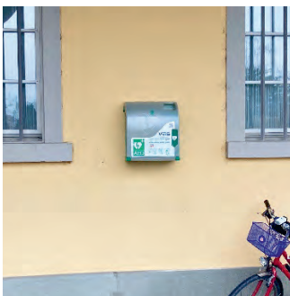
Rathaus Thal Arkade zu Friedhof