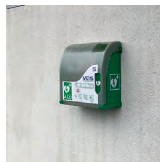
Hafen Staad unter Treppenaufstieg