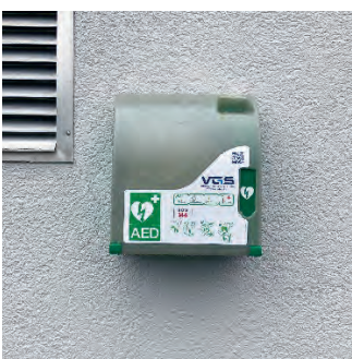
Doppeltturnhalle Bützel Eingang Küche