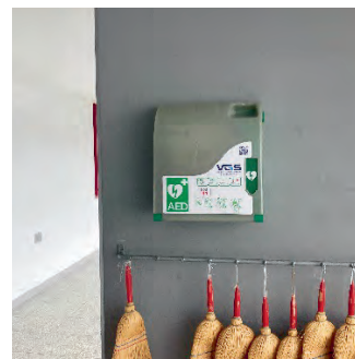
Oberstufenzentrum Thal Unter Singsaal / Eingang