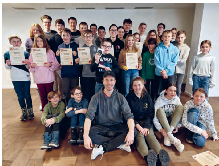
Die Ministrant*innen geniessen feine Pizzen und warteten gespannt auf die begehrten Urkunden der «besten Minis des Jahres»

Die Segnung und Auflegung der Asche fi det im Rahmen der Wortgottesfeier statt.