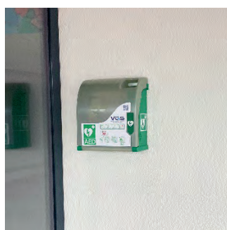
Schulhaus Altenrhein Pausenhalle