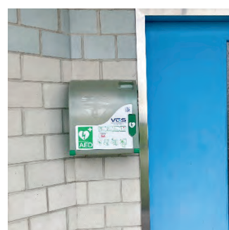
Badi Altenrhein Badehütte (nur während Badesaison in Betrieb)