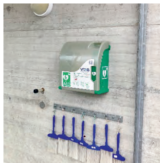
Turnhalle Feld Rampe zur Turnhalle / Eingang