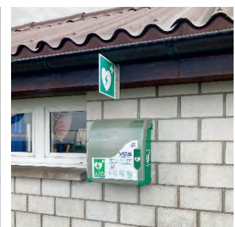
Badi Speck Haupteingang (nur während Badesaison in Betrieb)