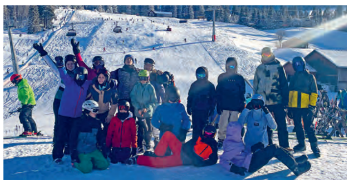
Snowday in Wildhaus für alle Oberstüfler. Wir vergnügten uns bei Sonnenschein und eiskalten Temperaturen

Für Oberstufenschüler:innen ab 18.00 Uhr im Jugendchäller Buechen-Staad zum gemeinsamen spielen, plaudern und chillen.