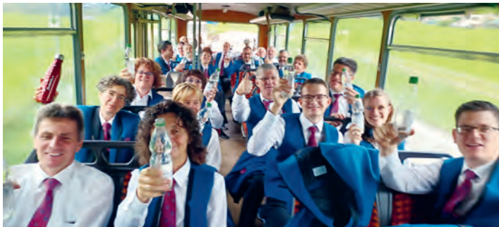
Auf der Fahrt nach Rapperswil mit an den bevorstehenden Auftritt angepassten Getränken...