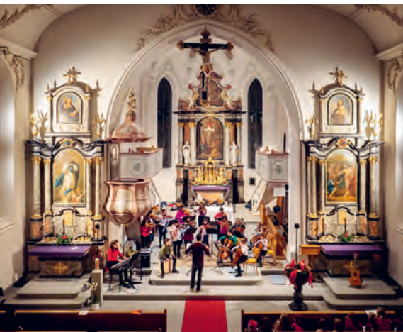
Die Kirche Thal bietet einen würdigen Rahmen für das Weihnachtskonzert.

Das grosse Weihnachtskonzert der Musikschule in der Kirche Thal findet in diesem Jahr am 2. Adventssonntag, den 4. Dezember um 17.00 Uhr statt. Geplant sind festliche Beiträge der Blockflöten-, Streicher- und Gitarrenensembles. Aber auch Chor und solistisch auftretende Schüler*innen werden zur vorweihnachtlichen Stimmung beitragen. Es ergeht herzliche Einladung an die gesamte Bevölkerung.