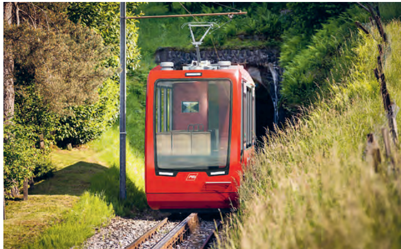
Visualisierung des neuen Fahrzeugs der Bergbahn Rheineck – Walzenhausen.

1896 wurde die Bergbahn Rheineck – Walzenhausen eröffnet. 1958 erfolgte die Inbetriebnahme des derzeitigen Fahrzeugs, das heute am Ende seiner Lebensdauer steht. Nachdem sich Bund, Kantone und Anrainergemeinden für den Weiterbestand der Bahn entschieden haben, setzen die Appenzeller Bahnen als Betreiberin der Linie Rheineck – Walzenhausen ein einzigartiges Projekt um: Künftig wird die neue Bahn das Unterrheintal mit dem Appenzeller Vorderland vollautomatisch und ohne Wagenführer verbinden. Mit dem neuen Schienenfahrzeug wird die erste vollautomatisierte Überland-Adhäsions- und Zahnradbahn der Welt entstehen. Die Produktion des Triebwagens erfolgt bei der unter anderem in St. Margrethen und Altenrhein ansässigen, auf Schienenfahrzeuge spezialisierten Firma Stadler Rail. Die Inbetriebnahme ist 2026 vorgesehen. Mit der neuen Bahn erhofft man sich nicht zuletzt eine weitere touristische Belebung der Region, die mit dem seit dreissig Jahren bestehenden Witzwanderweg klar an Profil gewonnen hat.