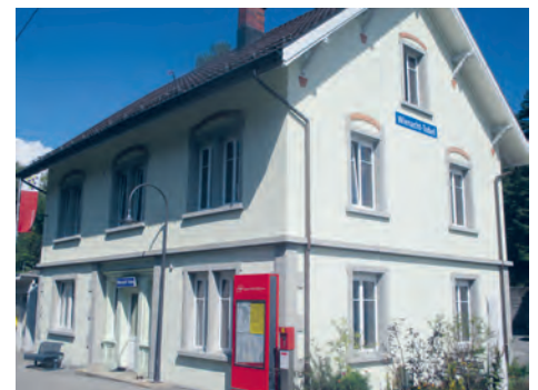
Nach der Privatisierung wurde dem Bahnhofgebäude mit einer umfassenden Renovation zu neuem Glanz verholfen.

1875 wurde die Rorschach-Heiden-Bergbahn eröffnet. Damit avancierte das kleine, zu Lutzenberg gehörende Dorf Wienacht-Tobel zum beliebten Kurort mit einer Reihe von Hotels und Pensionen. Mittlerweile sind sie alle verschwunden, und auch der Bahnhof hat seine einstige Bedeutung verloren. Das Gebäude wurde verkauft, und die neue Eigentümerschaft hat das Wahrzeichen des einst blühenden Fremdenverkehrs sorgfältig restauriert. Heute diente das Gebäude als Werkstatt, Büro und Wohnraum.