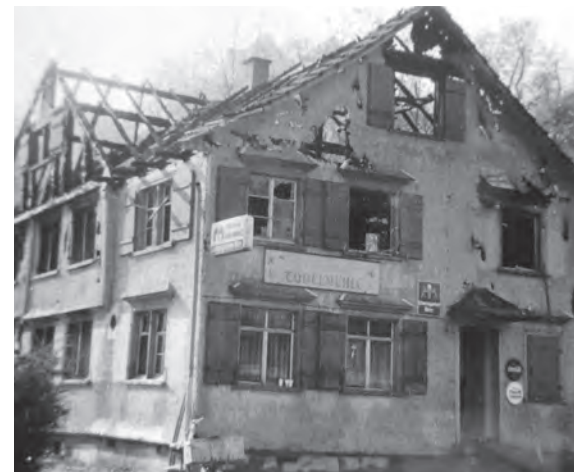
Vor 50 Jahren wurde die Wirtschaft «Tobelmühle» ein Raub der Flammen. Text und Bild: egb

Bereits vor dem Brand von 1972 war die Bäckerei aufgegeben worden. Nach dem Abbruch der Brandruine entstand an gleicher Stelle ein Neubau, der im Herbst 1974 als Restaurant mit Kegelbahn eröffnet wurde. Später erfolgte die Umbenennung von «Tobelmühle» in «Mer isch glich», und dieser Name hat sich mittlerweile etabliert.