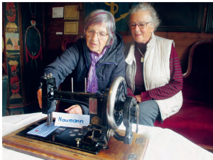
Zwei Besucherinnen schwelgen angesichts dieser nostalgischen Nähmaschine mit Handantrieb in Erinnerungen.