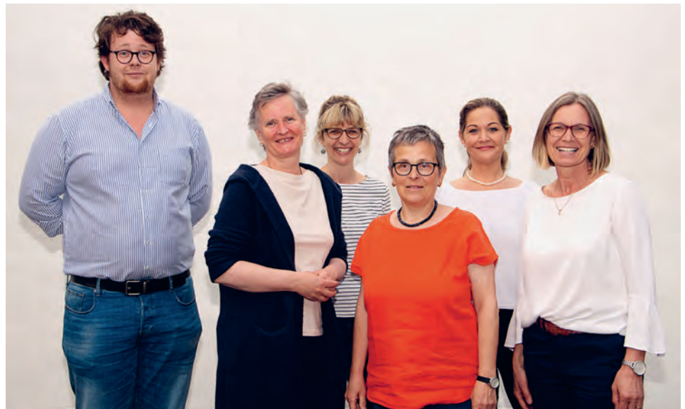
Vorstand des Gospel-Chor RhyTha

Am Th ler Jahrmart hat sich erstmals der Gospelchor zusammen mit den Männerchörlern einen Stand geteilt. Unter dem Motto «singen verbindet» brachten die Männer- und Gospelsänger leckere selbstgebackene Kuchen ans vorbeiziehende Volk.