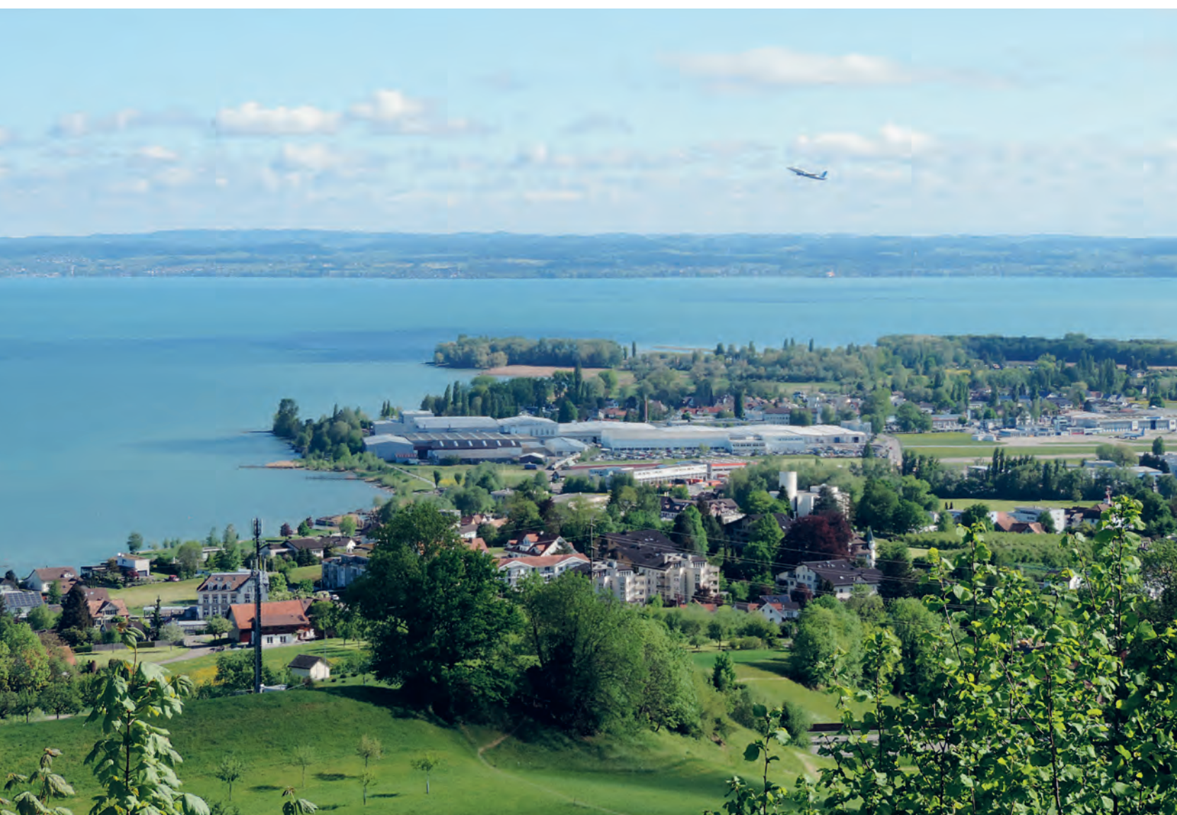
Blick auf Altenrhein

Informationen der Politischen Gemeinde, Mitteilungen der Vereine, Aktuelles aus Thal, Staad, Buechen und Altenrhein