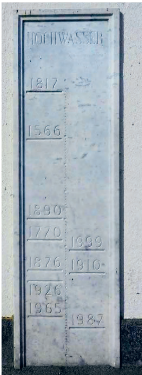
Hochwassermarken am Kornhaus Rorschach

(Nichtmitglieder Fr. 10.–), Abo-Besitzer gratis