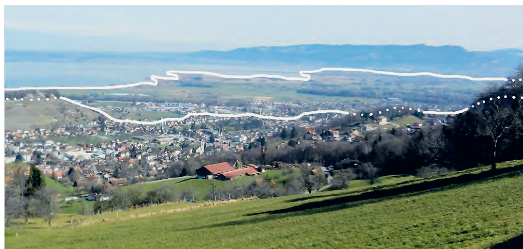
Überschwemmte Gebiete 1816 (Blick von Lutzenberg aus)