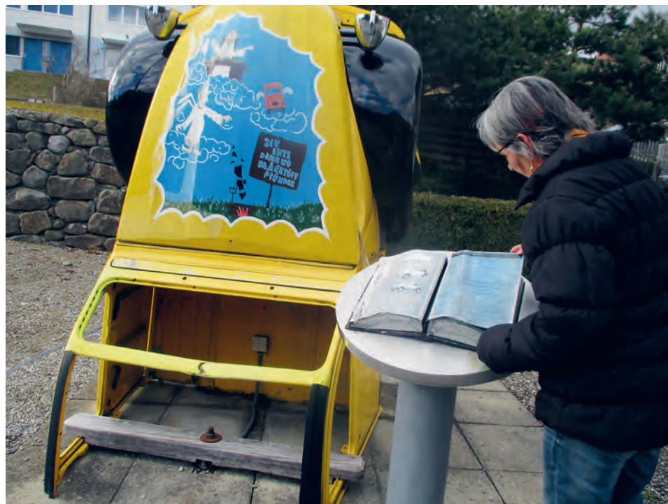
Die knallgelbe Ente in Schachen Reute ist ein vielbestaunter Blickfang.

Nicht zu übersehen ist an der Durchgangsstrasse Oberegg – Reute – Berneck die himmelwärts ragende knallgelbe Ente. Das auf die französische Automarke Citroën spezialisierte, seit 1985 in Schachen-Reute tätige und heute pensionierte Garagisten-Ehepaar Peter und Corrie Sprüngli hat zu Ehren des berühmten Kultautos Döschwo ein Denkmal errichtet, das zum vielbestaunten Blickfang geworden ist. Das beiliegende Handbuch regt zum Blättern an und ruft wesentliche Daten rund um die Geschichte des 2CV-Autos in Erinnerung. 1948 trat das kostengünstige Gefährt erstmals in Erscheinung, das bis 1990 produziert wurde. Wenn auch selten, so sind Freunde des liebevoll «Ente» genannte Autos noch immer auf unseren Strassen anzutreffen.