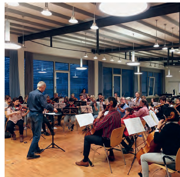
Probenarbeit zum letzten Gemeinschaftskonzert vor vier Jahren