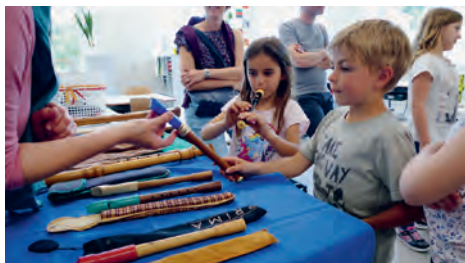
Alle Instrumente können beim Infoabend ausprobiert werden

Im Anschluss an den Infotag bieten die Wochen des Offenen Unterrichts eine weitere Möglichkeit den Unterricht im gewünschten Fach kennenzulernen. Alle interessierten Eltern und Schüler können vom 9. bis 20. Mai den Unterricht im gesamten Musikschulgebiet besuchen. Anmeldungen werden erbeten über das Sekretariat der Musikschule unter 071 888 52 66 oder per Mail an info@msaar.ch .