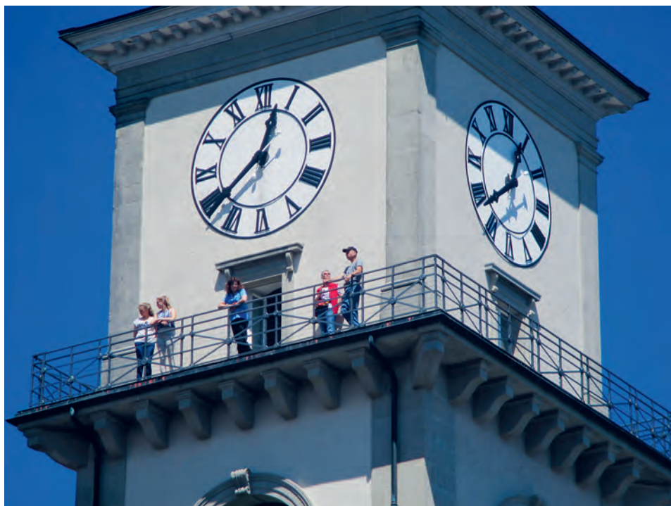
Dank der einmaligen Fernsicht gehört der Kirchturm von Heiden zu den Attraktionen im Appenzeller Vorderland.

Im Gegensatz zur grossen Mehrheit der Kirchtürme ist das 41 Meter hohe Wahrzeichen von Heiden der Öffentlichkeit zugänglich. Nach dem Aufstieg über 157 Stufen eröffnet sich auf der Zinne eine unvergleichliche Fernsicht in alle Himmelsrichtungen. Thomas Oetiker, Kirchturmwart, freut sich über das grosse Interesse. «Unser Turm war an 135 Nachmittagen geöffnet. Zudem wurde das Turmzimmer 25-mal für private Anlässe gebucht.» Bereits jetzt ist klar, dass der Kirch- und Aussichtsturm auch im Sommerhalbjahr 2022 beliebtes Ziel für zahlreiche Gäste sein wird.