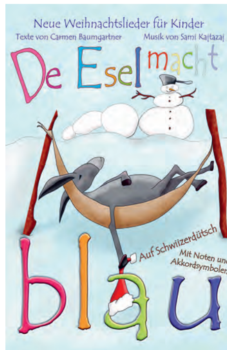
Das Titelbild des geplanten Liederbuches

Nun ruft die Musikschule alle Kinder zwischen der 1. und 6. Klasse zum grossen Malwettbewerb auf. Gesucht sind dreizehn originelle Bilder, passend zu den Liedern und Texten von Sami Kajtazaj und Carmen Baumgartner. Ausführliche Details erhalten die kleinen Künstler auf der Homepage der Musikschule oder über ihre Klassenlehrpersonen. Die Kinder können ihre Zeichnungen bis zum 30. Mai 2022 in ihren Schulhäusern in die dort aufgestellte Musikschulbox einwerfen.