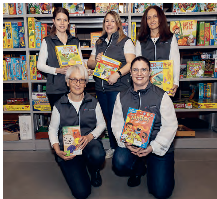
Der neue Vorstand der Ludothek Rheineck:

Das komplette Sortiment der Ludothek kann online unter www.ludo-rheineck.ch mit Beschreibung und Bildern der Artikel, unterteilt nach Kategorien und Suchkriterien durchstöbert werden. Auf der Website ist auch direkt ersichtlich, ob das Produkt gerade ausgeliehen ist, und es kann nach Wunsch direkt online reserviert werden.