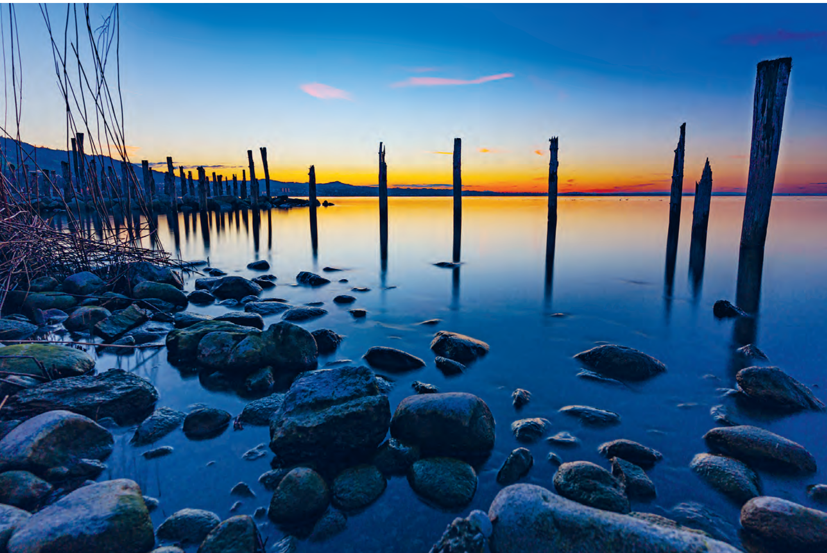
Sonnenuntergang am Seeufer Altenrhein, Blick Richtung Rorschach

Informationen der Politischen Gemeinde, Mitteilungen der Vereine, Aktuelles aus Thal, Staad, Buechen und Altenrhein